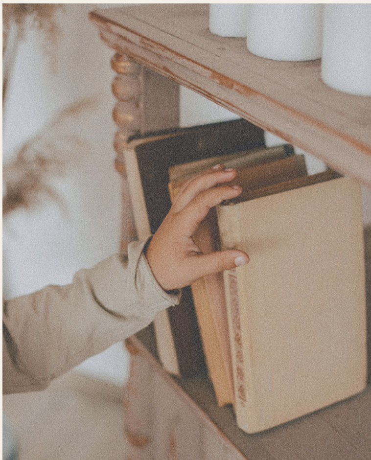
● פרופ' חיים סעדון, "השואה לא פסחה גם על הספרדים: סיפורה של השואה המזרחית", יום ליום, גיליון 1225, 12 במאי 2011, עמ' 6-12.